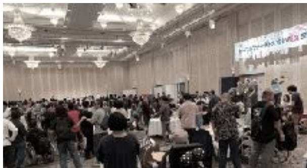
こうりゅうかい にぎやかな交流会

かいかいしき きゅうゆうせい 開会式では旧優生 ほごほうさいばん げんこく 保護法裁判の原告 かたがた ちよくせつ の方々から直接お はなし き 話を聞くことがで きました。閉会式 へいかいしき では、発言したい はつげん 人が手を挙げて、 ひと て あ 指名されるとマイク しめい まいく