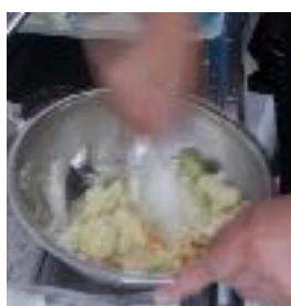
ちょうりじっしゅう アトリエすむち調理実習より

わたし せいかく くうき よ ひと かおいる 私の性格は、空気を読んだり、人の顔