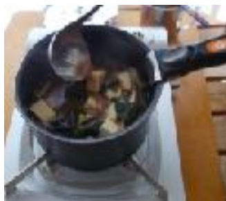
ちょうりじっしゅう アトリエすむち調理実習より